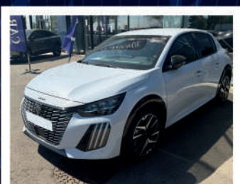
e208 GT 136ch 27/11/2025 | 2 kms