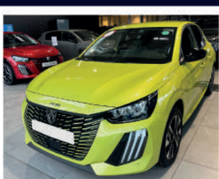
208 e-208 156ch Allure 29/08/2025 | 10 kms