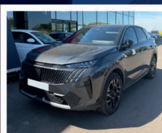
3008 GT Hybrid 145ch 30/01/2025 | 6000 kms