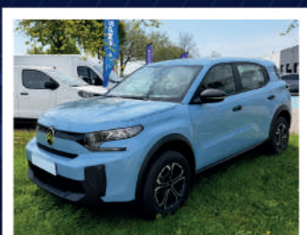
Nouveau C3 Aircross Turbo 100ch | 30/07/2025 1000 kms

500L de carburant offert ou une borne de recharge offerte*