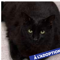
Nemo, 10 ans

Nemo est de ces chats qui n'abandonnent pas. Même quand on les abandonne. Pris en charge par notre association suite à une enquête sur Audun-le-Tiche, Nemo a une histoire qui serre le cœur. Accidenté il y a bien longtemps, il n'a jamais été soigné . Il en garde aujourd'hui une boiterie importante , souvenir permanent de la douleur et du manque de soins . Mais ce n'est pas tout. Il y a peu, Nemo a été mis dehors . Et surtout... Il n'avait plus le droit de rentrer. Pourtant, Nemo est resté jour après jour, devant la maison. À attendre. À espérer. Fidèle, malgré tout. Aujourd'hui, Nemo a 10 ans . Il est FIV positif . Il ne cherche pas une vie pleine d'agitation. Il cherche un foyer calme , une présence rassurante , un endroit où il n'aura plus jamais à attendre devant une porte fermée. Malgré ce qu'il a vécu, Nemo reste un chat attachant, profondément touchant , avec son petit caractère à lui . Un chat qui mérite enfin qu'on le choisisse... pour de bon .