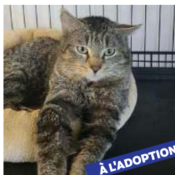
Taiko, environ 4 ans

Nemo est de ces chats qui n'abandonnent pas. Même quand on les abandonne. Pris en charge par notre association suite à une enquête sur Audun-le-Tiche, Nemo a une histoire qui serre le cœur. Accidenté il y a bien longtemps, il n'a jamais été soigné . Il en garde aujourd'hui une boiterie importante , souvenir permanent de la douleur et du manque de soins . Mais ce n'est pas tout. Il y a peu, Nemo a été mis dehors . Et surtout... Il n'avait plus le droit de rentrer. Pourtant, Nemo est resté jour après jour, devant la maison. À attendre. À espérer. Fidèle, malgré tout. Aujourd'hui, Nemo a 10 ans . Il est FIV positif . Il ne cherche pas une vie pleine d'agitation. Il cherche un foyer calme , une présence rassurante , un endroit où il n'aura plus jamais à attendre devant une porte fermée. Malgré ce qu'il a vécu, Nemo reste un chat attachant, profondément touchant , avec son petit caractère à lui . Un chat qui mérite enfin qu'on le choisisse... pour de bon .