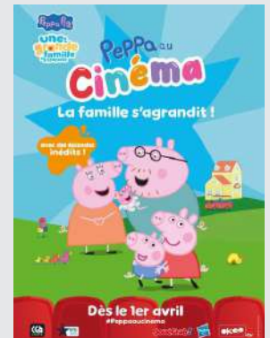
Animation, Historique | Durée : 1h49

Papa Pig prépare son tout premier marathon, George explore de nouvelles façons d'écouter et de comprendre le monde, et bien d'autres aventures ! Entre sauts dans les flaques de boue, éclats de rire et moments riches en émotions : De nouvelles aventures et des épisodes déjà culte !