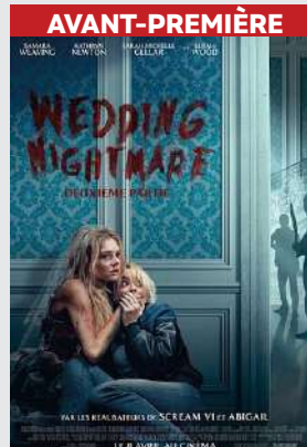
Animation, Historique | Durée : 1h49

Peu après avoir échappé à l'attaque sans merci de la famille Le Domas, Grace découvre qu'elle vient d'atteindre un nouveau niveau dans ce jeu cauchemardesque – et elle aura à ses côtés sa sœur dont elle s'était éloignée, Faith.