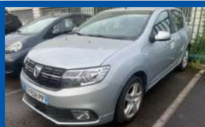
DACIA SANDERO SCE 1.0 BOÎTE MANUELLE - ESSENCE - 2019 GRIS METAL - CLIM. - REGULATEUR DE VITESSE - GPS - 75CV - 70 500 KMS GARANTIE 3 MOIS