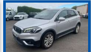
SUZUKI S-CROSS 1.0 PRIVILEGE BOÎTE MANUELLE - DIESEL - 2017 - GRISE CAMERA DE RECULE - 110CV - 144 800 KMS GARANTIE 6 MOIS