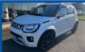
SUZUKI IGNIS PRIVILEGE ALLGRIP BOÎTE MANUELLE - ESSENCE - 2021 - BLANC CAMERA - CLIM - 4 WD - JANTE ALU 83CV - 92 500 KMS - GARANTIE 6 MOIS