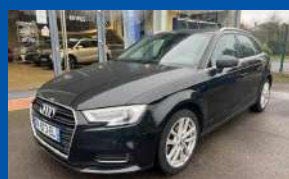
AUDI A3 III (2) SPORTBACK 2.0 TDI 150 DESIGN S TRONIC 7 BOÎTE AUTO - DIESEL - 2018 - BLANCHE 150CV - 186 800 KMS - GARANTIE 6 MOIS