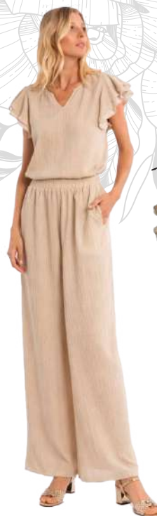
MOLLY BRACKEN Ensemble haut & pantalon fluide en semi-transparence