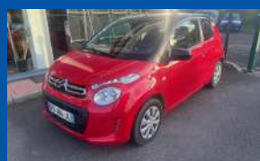
CITROËN C1 II 1.0 VTI 72 FEEL 3P BOÎTE MANUELLE - ESSENCE - 2019 ROUGE & NOIR - 72CV - 71 000 KMS 3 PORTES - 1ERE MAIN