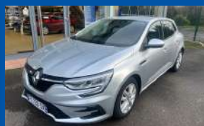
RENAULT MEGANE IV 1.5 BLEU DCI 115 BUSINESS BOÎTE MANUELLE - DIESEL - 2021 - GRIS METAL - RADAR AV./AR. - REGULATEUR 116CV - 95 890 KMS - GARANTIE 6 MOIS