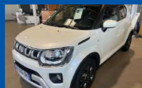
SUZUKI IGNIS III (2) 1.2 DUALJET HYBRID PRIVILEGE BOÎTE MANUELLE - ESSENCE - 2024 - BLANC CAMERA - SIEGE CHAUFFANT - JANTE ALU 83CV - 8 070 KMS - GARANTIE CONSTRUCTEUR