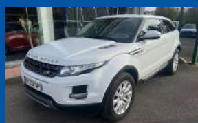
RANGE ROVER EVOQUE 2.2 ED4 PURE PACK TECH 4X4 BOÎTE MANUELLE - DIESEL - 2014 - BLANCHE 150CV - 74 500 KMS - GARANTIE 6 MOIS