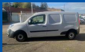
RENAULT KANGOO EXPRESS II (2) MAXI GRAND VOLUME DCI 90 BOÎTE MANUELLE - DIESEL - 2017 - BLANC - BLUETOOTH - AIDE PARKING - ROUE DE SECOURS 90CV - 90 627 KMS - GARANTIE 3 MOIS