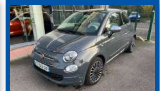
FIAT 500 1.2 8V ECO PACK BOÎTE MANUELLE - ESSENCE - 2019 - GRISE 69CV - 102 000 KMS - GARANTIE 6 MOIS