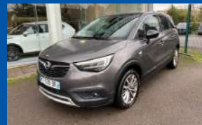
OPEL CROSSLAND X 1.2 TURBO OPEL 2020 BOÎTE AUTO - ESSENCE - 2020 - GRISE 130CV - 45 200 KMS - GARANTIE 6 MOIS