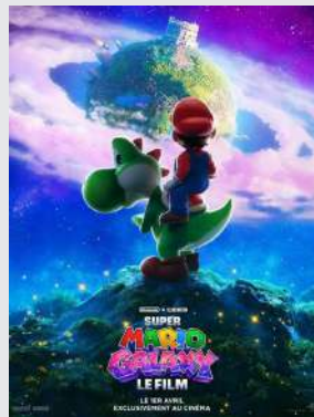
Action, Animation | Durée : 1h38

Au-delà du Royaume Champignon, Mario, Luigi et Yoshi voyagent à travers les galaxies aux côtés de Rosalina pour arrêter Bowser Jr., dont la tentative de sauver son père menace l'équilibre de l'univers.