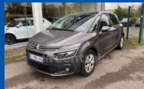
CITROËN C4 SPACETOUREUR 1.5 BLUE HDI S&S LIVE EAT8 BOÎTE AUTO - DIESEL - 2019 - GRISE 130CV - 68 000 KMS - GARANTIE 6 MOIS