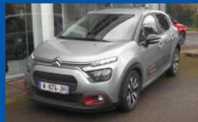
CITROËN C3 III (2) 1.2 PURETECH S&S C-SERIES BV6 BOÎTE MANUELLE - ESSENCE - 2021 - GRISE 110CV - 28 400 KMS - GARANTIE 6 MOIS