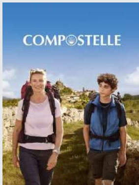
Comédie, Drame | Lumière sur...

Fred et Adam, un adolescent en rupture, ne se connaissent pas. Pourtant, grâce à une association, ils entreprennent ensemble le pèlerinage de Saint-Jacques-de-Compostelle. Elle cherche à apaiser son passé, il tente de canaliser sa colère et son sentiment d'abandon. Au fil des kilomètres, entre affrontements et instants suspendus, un lien fragile se tisse. Face aux épreuves du chemin, chacun découvre en lui une force insoupçonnée.